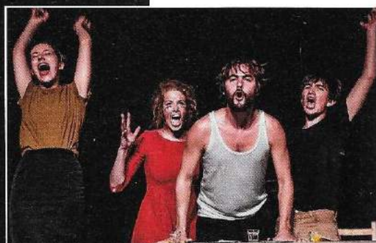
Quatuor Violence , par la Compagnie des divins animaux.