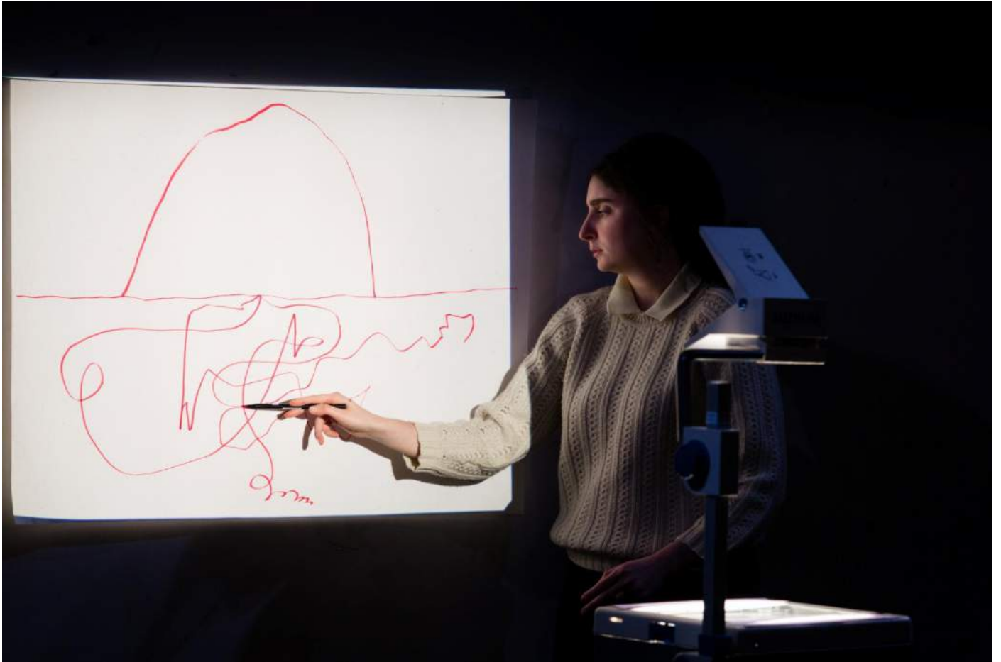
maquette – JTN, novembre 2016